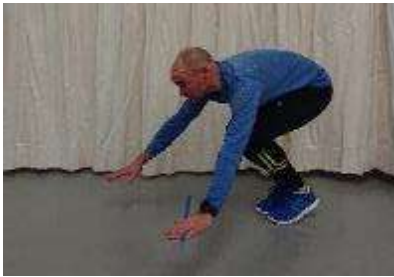
17.b polvet käsien välistä