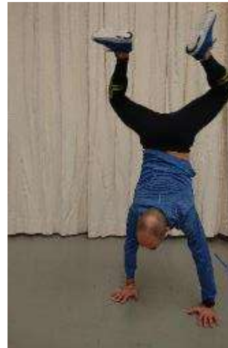
19.c käsinseisannon kautta