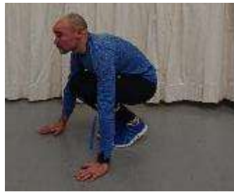
17.c Vuorotellen A ja B