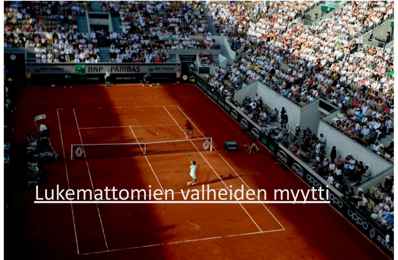
Tenniksessä liikkuu valtavasti vedonlyöntirahaa. Se on tehnyt lajista otollisen kohteen huijareille.