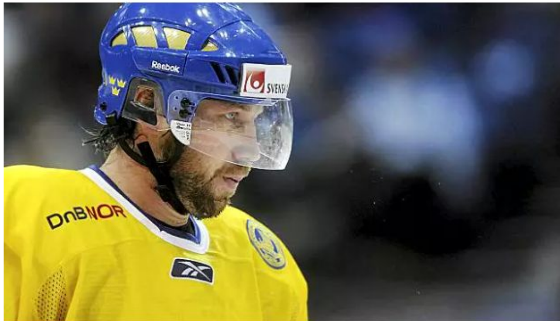
Peter Forsberg voitti olympiakultaa Torinossa.